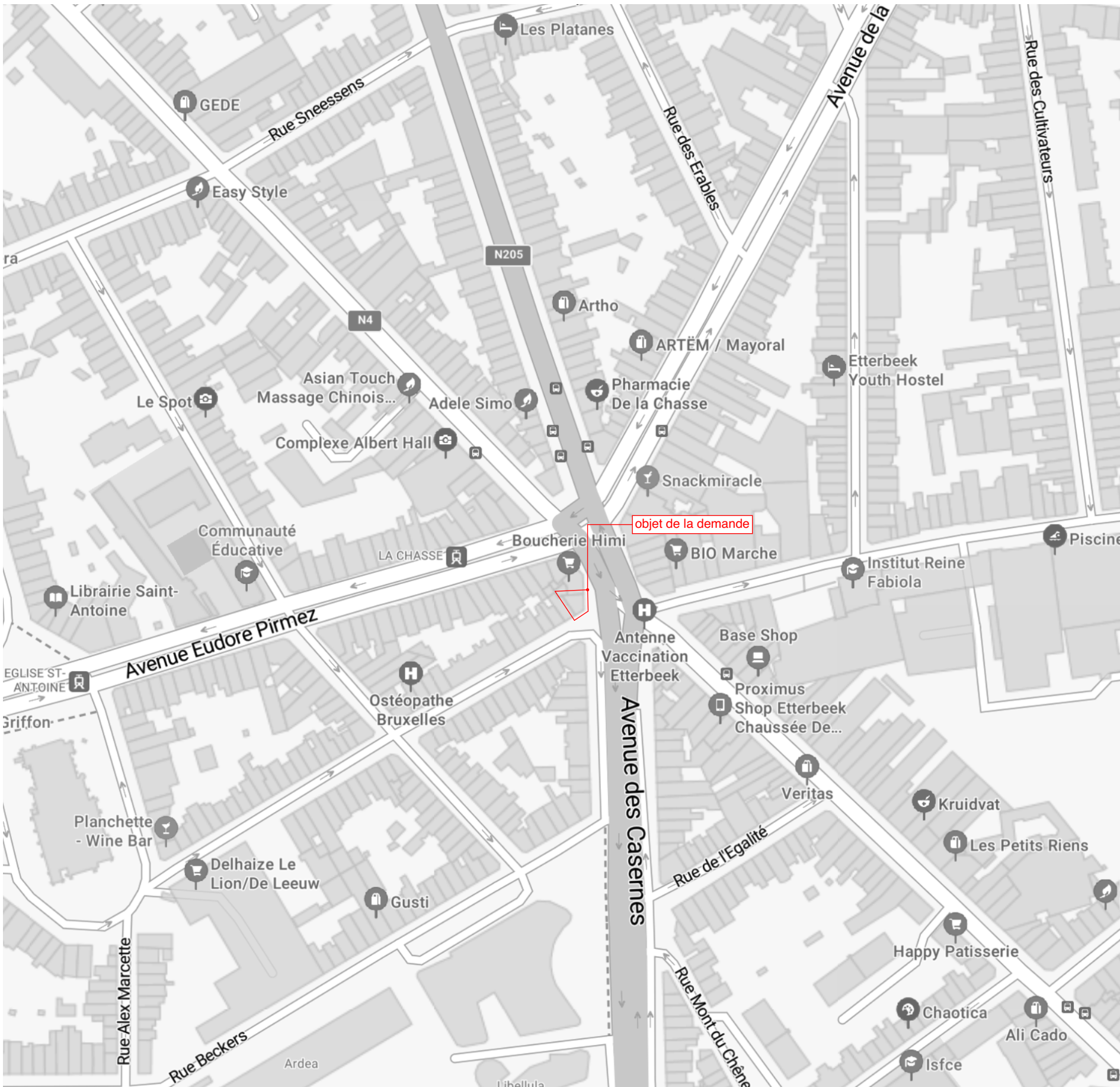
Plan de situation - 1/2000