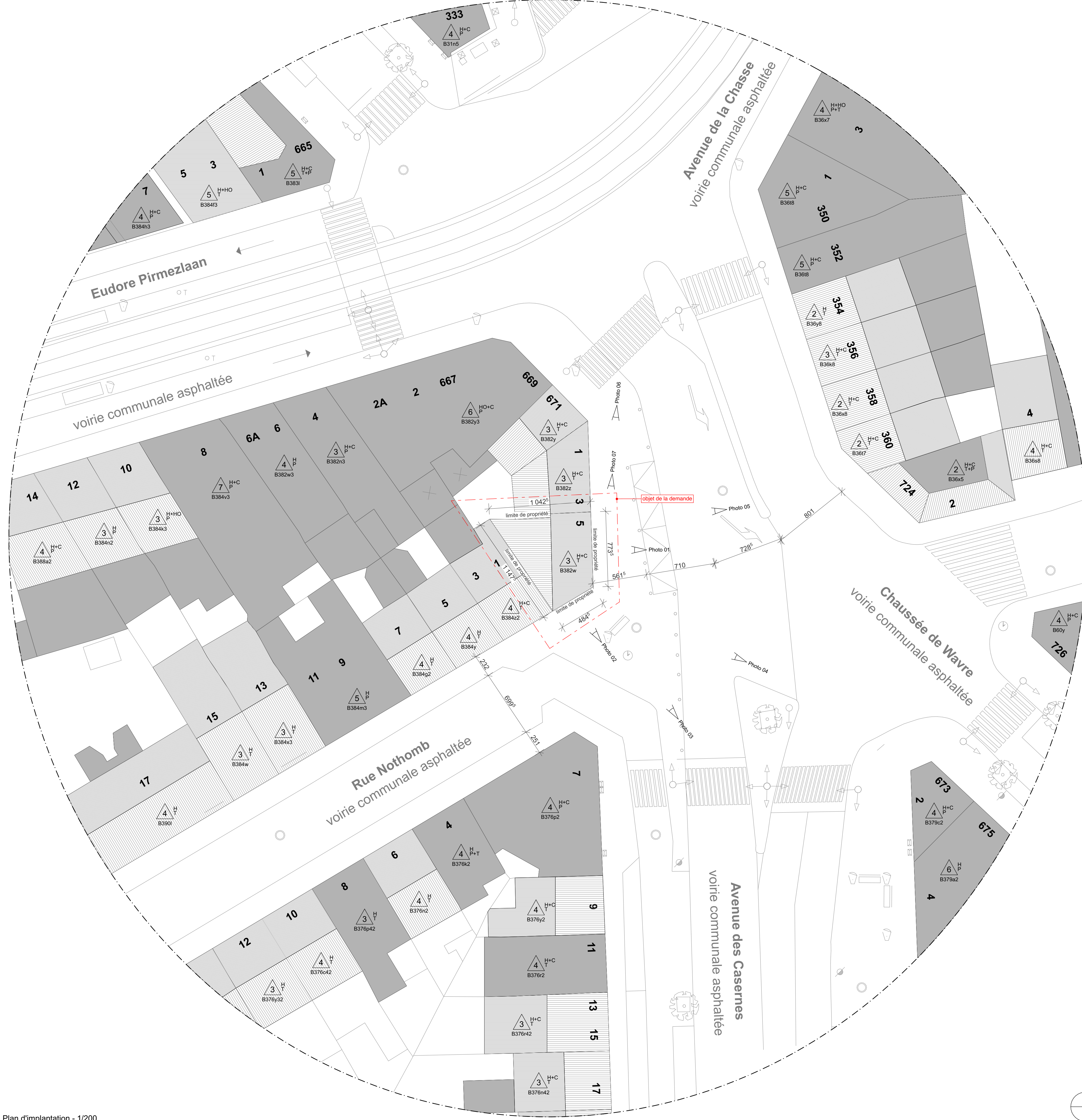
Plan d'implantation - 1/200